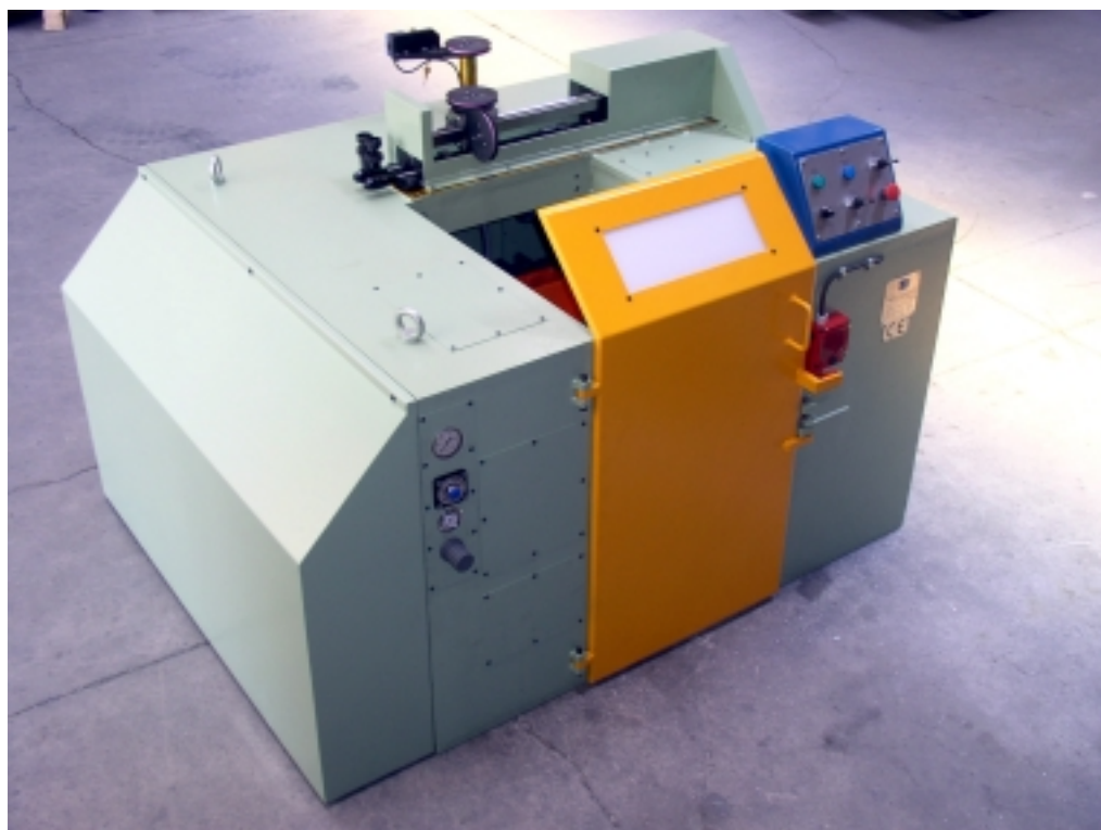
Encarretador ENC-800 Spooler ENC-800